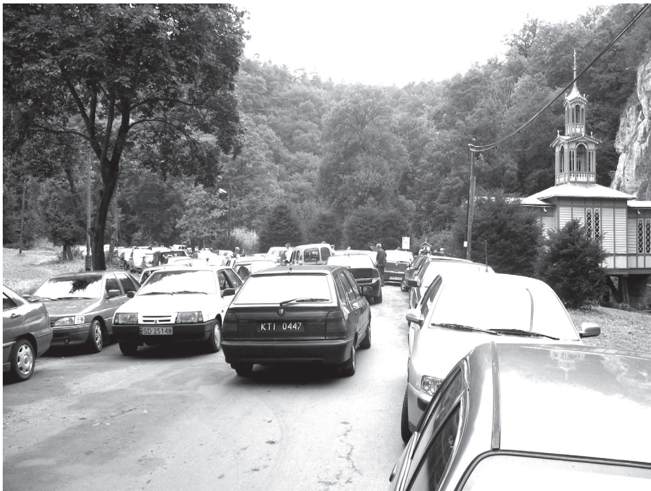
Ryc. 2. Ruch samochodowy w Ojcowskim Parku Narodowym. Fig. 2. Car traffic in the Ojcowski National Park.

W Ojcowskim Parku Narodowym wyznaczono niespełna 40 miejsc i obszarów dla celów turystycznych i rekreacyjnych. Są to pojedyncze obiekty (wystawy, jaskinie, punkty widokowe, obiekty gastronomiczne), parkingi, szlaki turystyczne i szlaki spacerowe. W większości tych miejsc może jednocześnie przebywać po kilkadziesiąt osób. Pewne limity w liczbie osób dotyczą przebywania na punktach widokowych, zwłaszcza tych eksponowanych i położonych kilkadziesiąt metrów nad dnem doliny Prądnika. Jedynie w rejonie Krakowskiej Bramy i przy źródle Miłości może jednocześnie przebywać do 250 osób, co w praktyce trudno ograniczać; są to bowiem bezpieczne miejsca wypoczynku zwłaszcza w dni wolne od pracy. Można tu łatwo dotrzeć pieszo lub konną dorożką. Poszczególne szlaki turystyczne, których długość w granicach OPN wynosi od 5 do ponad 13 km, mogą przyjąć po 500 osób. Natomiast dla wyznaczonych tras spacerowych i modnych od niedawna tras nordic walking ustalono limit 100 osób, dla zapewnienia pewnego komfortu przemieszczania się bez nadmiernego tłoku. Również duża liczba osób może jednocześnie korzystać z parkingów (250–500 osób).