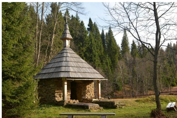
Widok na kaplicę Stroińskich i dwa nagrobki przed wejściem – tzw. Grób "Hrabiny"