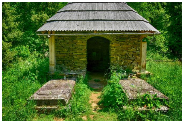
Widok na zniszczone nagrobki Stroińskich objętych pracami konserwatorskimi