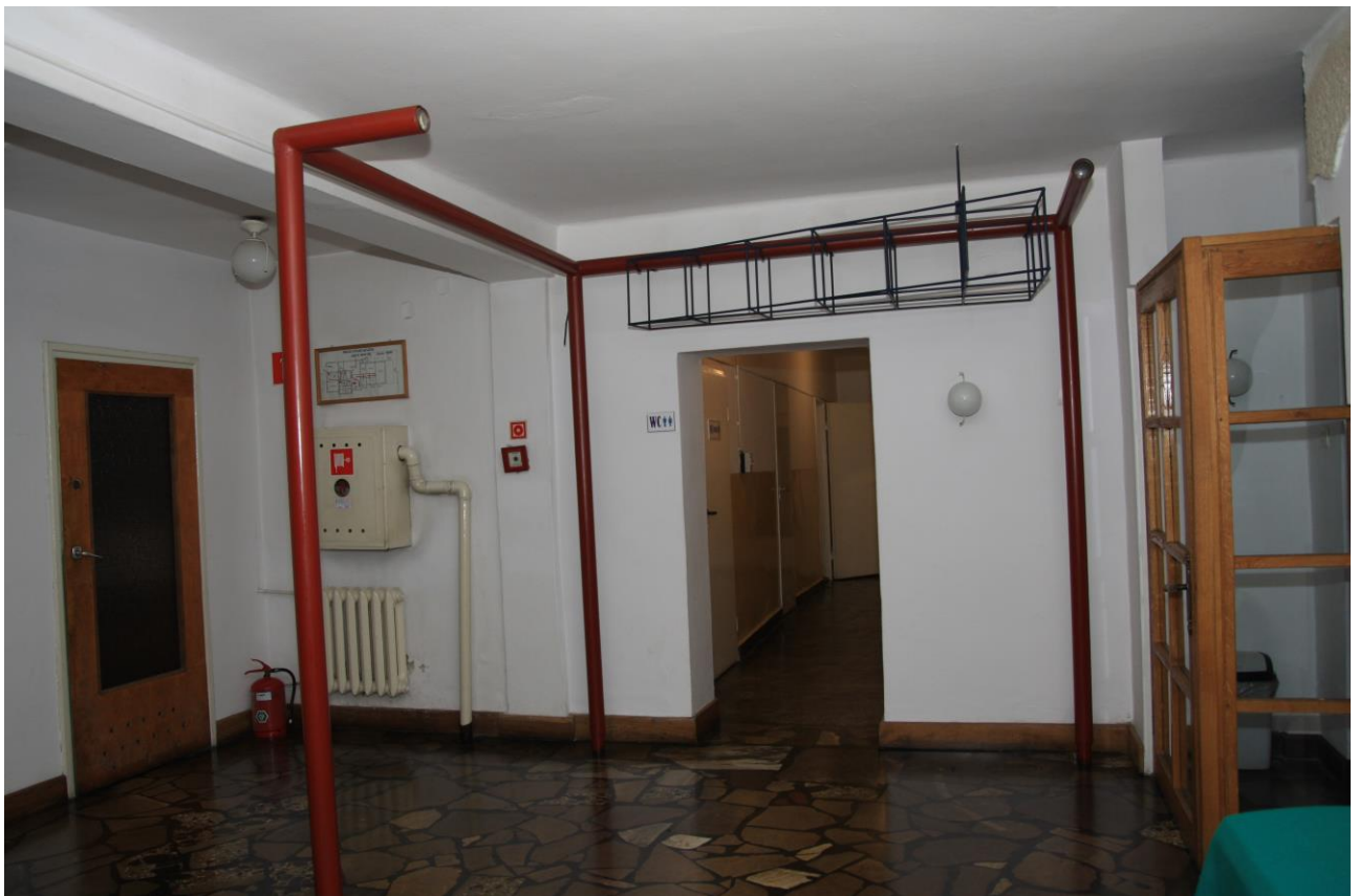
Podpiwniczenie z korytarzem prowadzącym do łazienek