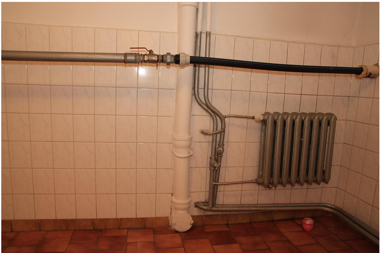
Łazienki – instalacje wymagające modernizacji i poprawy estetyki