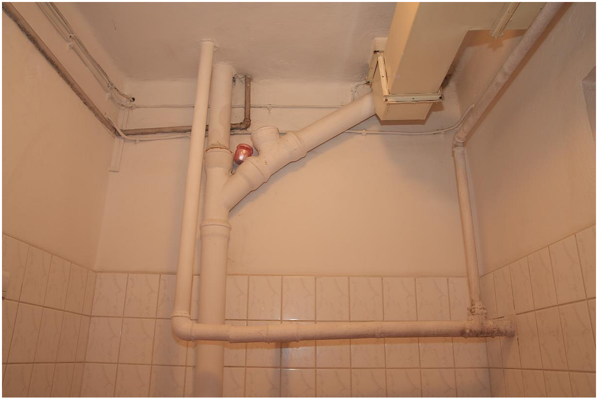
Łazienki – instalacje wymagające modernizacji i poprawy estetyki