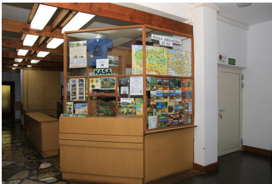
Hall z punktem informacyjno-kasowym oraz szatnią