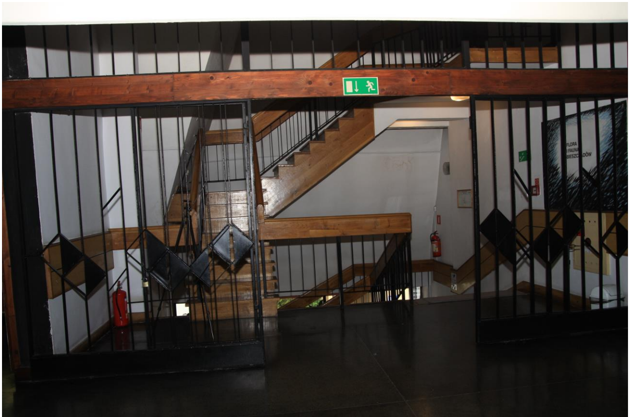
Klatka schodowa stanowiąca barierę architektoniczną dla osób niepełnosprawnych