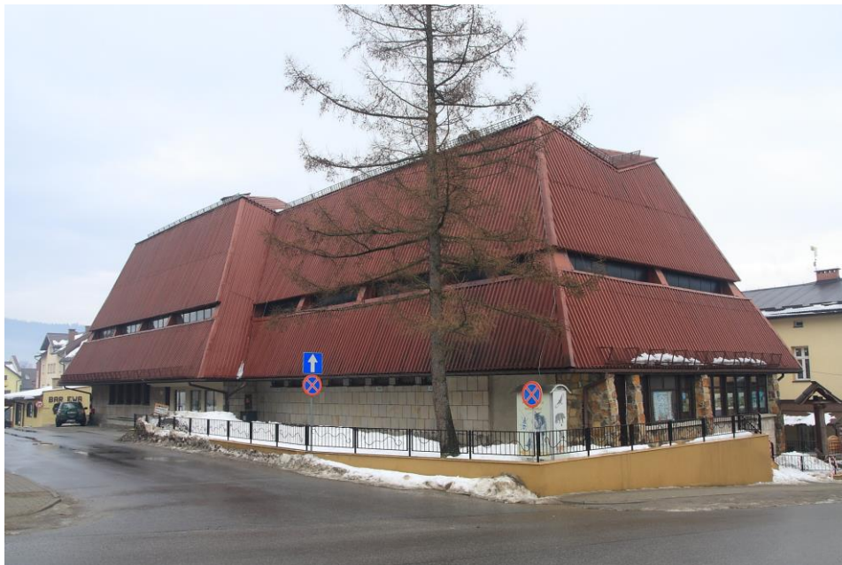
Ośrodek Edukacji Ekologicznej wraz z Muzeum Przyrodniczym – widok na budynek i wejście główne