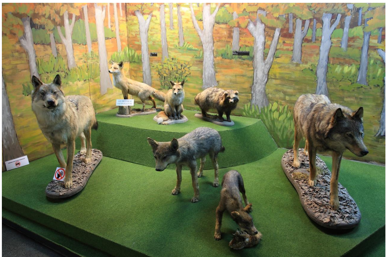
Fragment ekspozycji dot. Fauny Bieszczadów