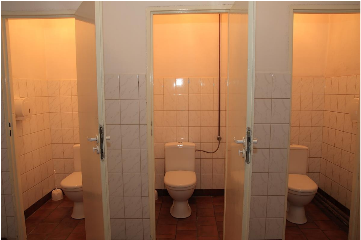
Łazienki wymagające poprawy estetycznego wyglądu oraz dostosowania do obecnych standardów