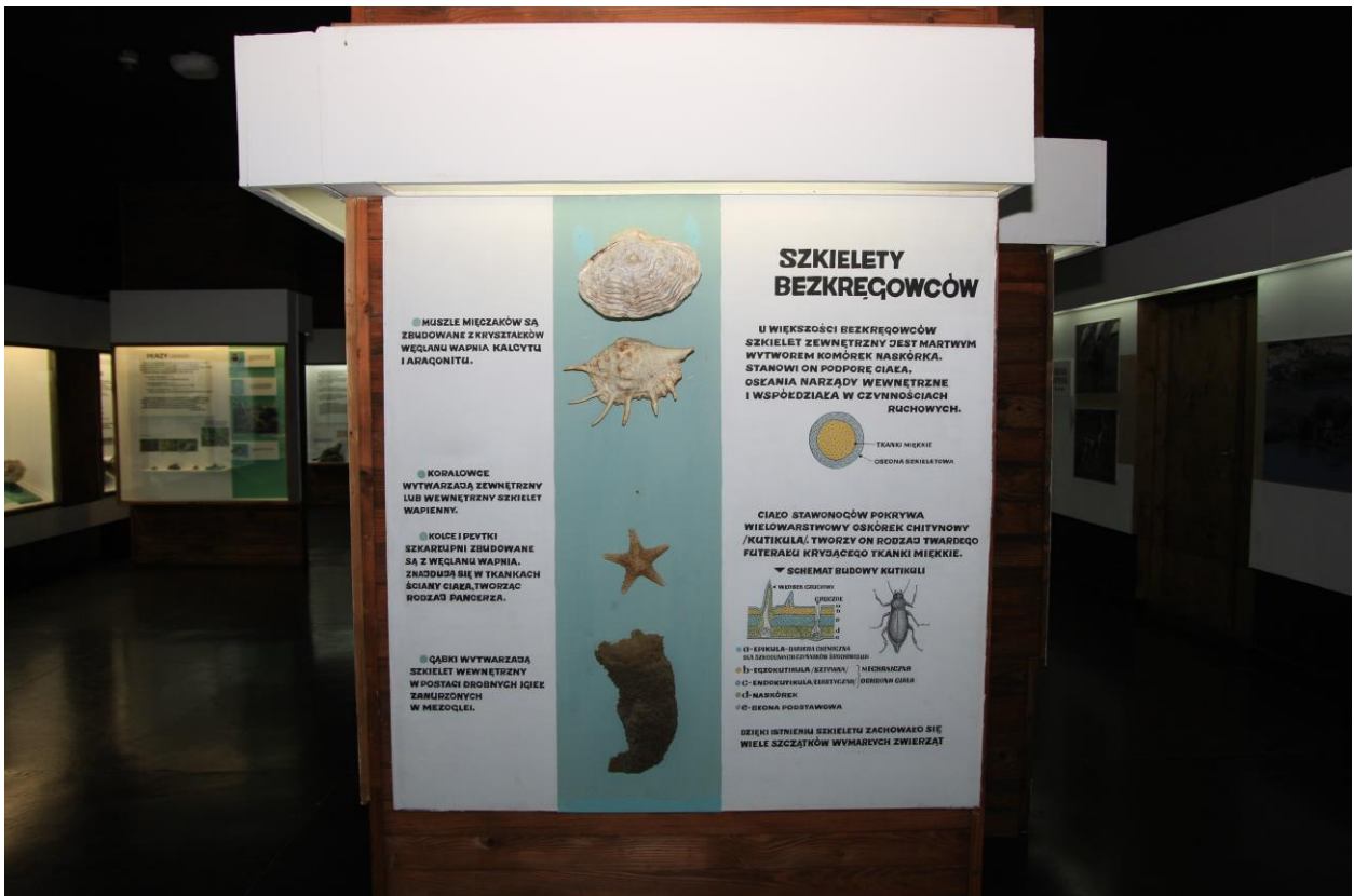
Fragment ekspozycji dot. Systematyki świata zwierząt