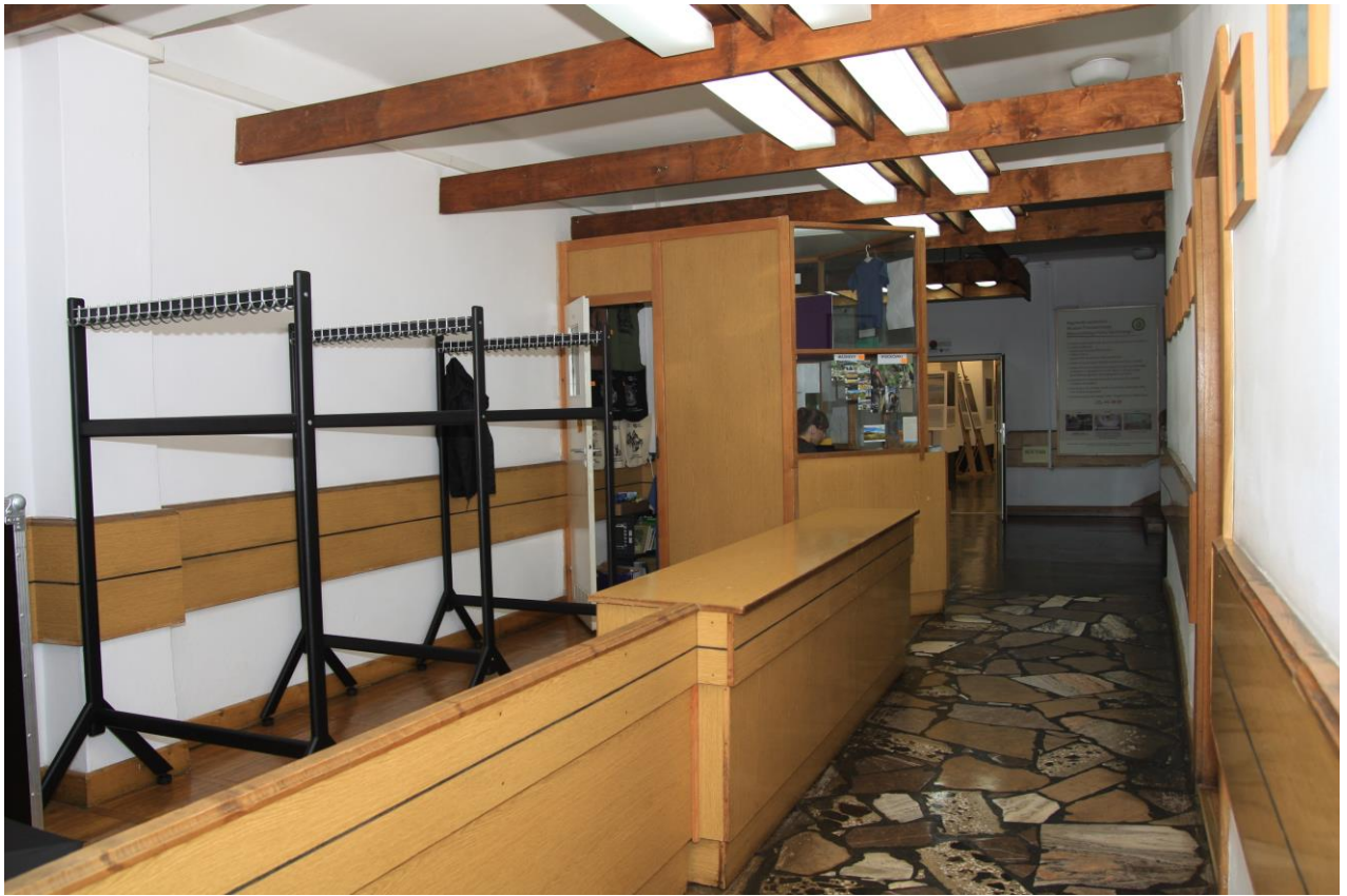
Hall z punktem informacyjno-kasowym oraz szatnią