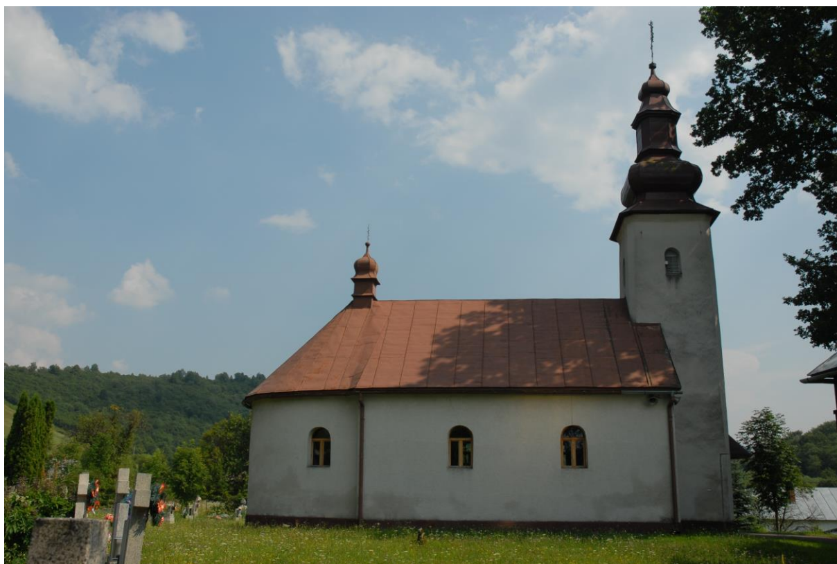
Fot. 1. Prislop – cerkiew pw. Zaśnięcia Przenajświętszej Bogurodzicy z 1993 r.

W 1998 r. wybudowano we wsi drugą cerkiew – prawosławną - pw. Zaśnięcia Przenajświętszej Bogurodzicy z 1998 r. (fot. 3).