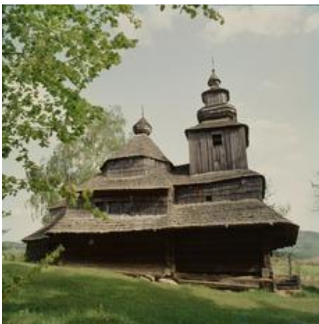
Fot. 2. Cerkiew pw. św. Michała Archanioła z 1764 r. w Novej Sedlicy – ok. 1978 r.