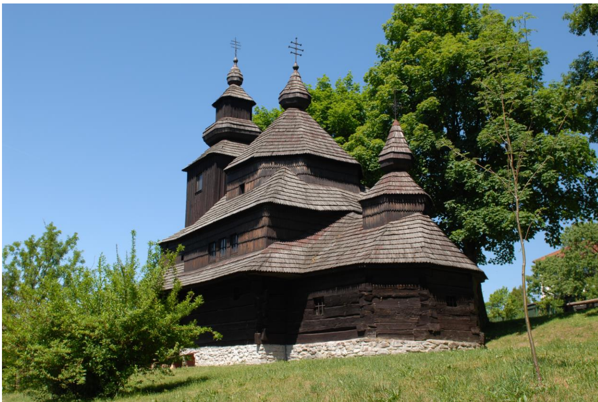
Fot. 1. Cerkiew pw. św. Michała Archanioła z 1764 r. z Novej Sedlicy, obecnie w skansenie w Humennem.