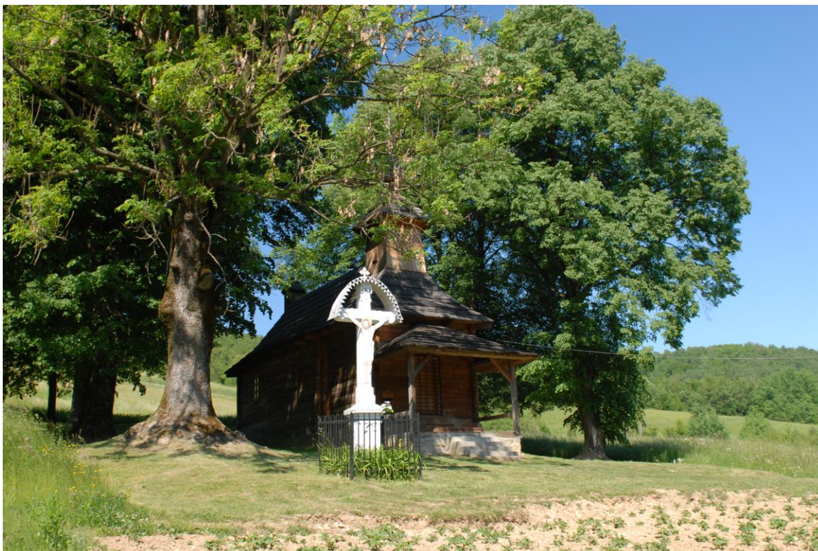
Fot. 2. Jalova – widok na cerkiew z 1792 r. i krzyż przycerkiewny.