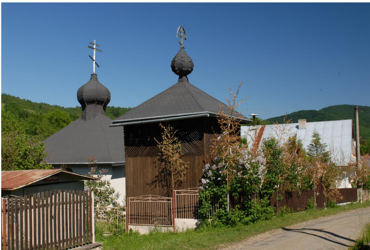
Fot. 3. Jalowa – cerkiew prawosławna pw. św. Jerzego Męczennika z 1999 r.