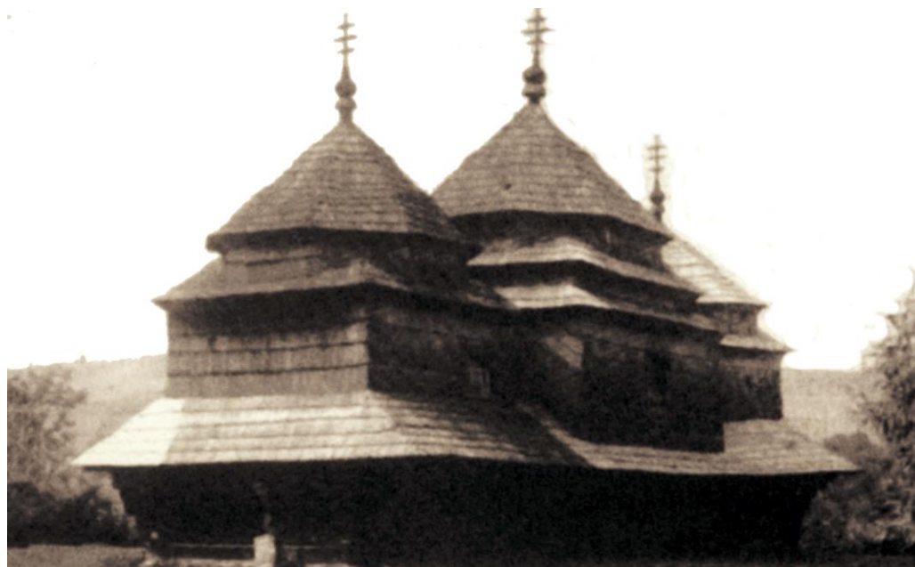
Ryc. 1. Sokoliki Górskie, cerkiew pw. św. Dymitra, 1791 r. (stan na 1937 r.).