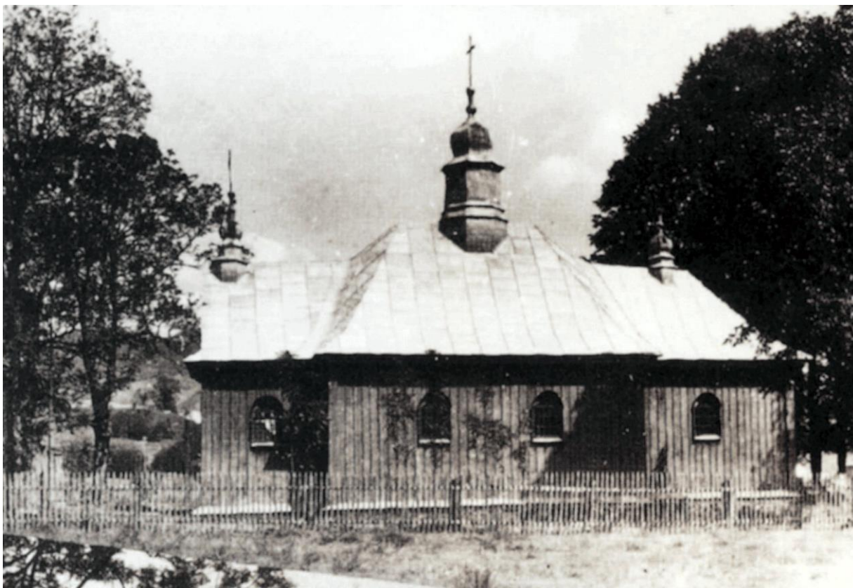
Ryc. 2. Cisna. Cerkiew greckokatolicka z 1825 r.