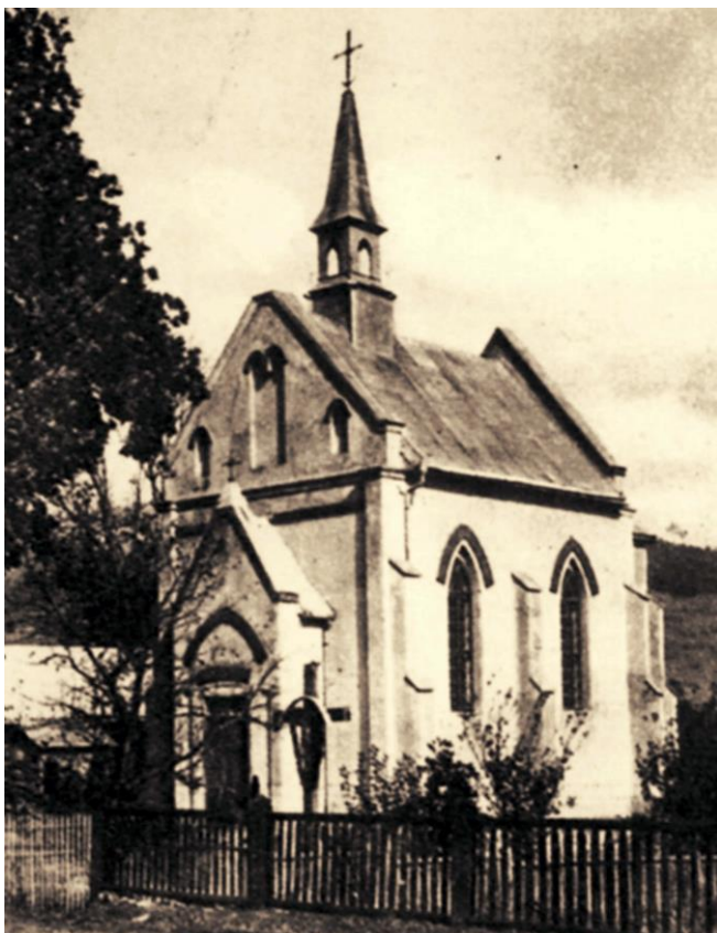
Ryc. 3. Cisna. Kościół rzymskokatolicki z 1914 r.