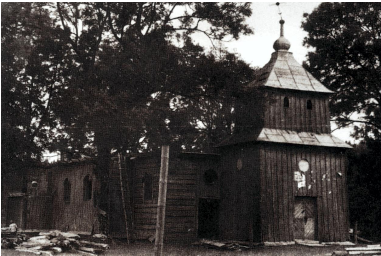
Ryc. 1. Cisna. Cerkiew greckokatolicka z 1785 r.

Parafia greckokatolicka w miejscu, dekanat Baligród 1 . Pierwsza wzmianka o cerkwi pochodzi z 1739 r., kiedy to właściciel wsi Michał Urbański nadał parafii greckokatolickiej w Cisnej uposażenie 2 . Pierwszą cerkiew greckokatolicką pw. św. Paraskewii wybudowano w 1785 r. (ryc. 1). Istniała ona do 1825 r., kiedy to wzniesiono nową, z fundacji Juliana hr. Fredro, właściciela „klucza ciśniańskiego”. Nowa cerkiew została poświęcona pod wezwaniem św. Michała Archanioła. Była to cerkiew drewniana, trójdzielna (ryc. 2) 3 . Szacunkowe wymiary budowli z planu katastralnego z 1852 r. wynosiły: nawa – 8 x 8 m, babiniec – 6 x 5 m i prezbiterium – 4 x 4 m. Każda z części nakryta była oddzielnym dachem kalenicowym z blachy. Nad nawą wznosił się okazały sześcioboczny hełm, natomiast dwa mniejsze wieńczyły dachy nad babiniecem i prezbiterium. Ściany były oszalowane deskami, z dużymi oknami. Cerkiew przetrwała II wojnę światową i stała opuszczona do 1956 r., kiedy to została rozebrana.